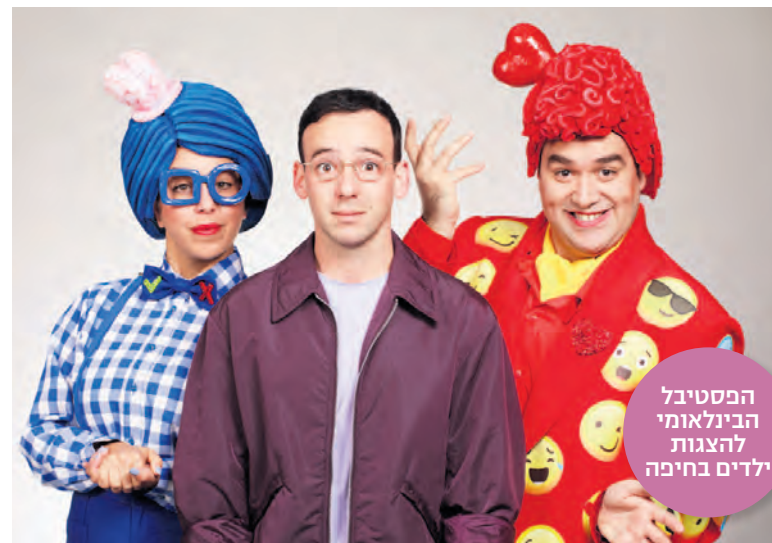
הפסטיבל הבינלאומי להצגות ילדים בחיפה