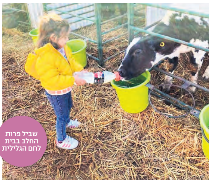
שביל פרות לחלב בבית לחם הגלילית