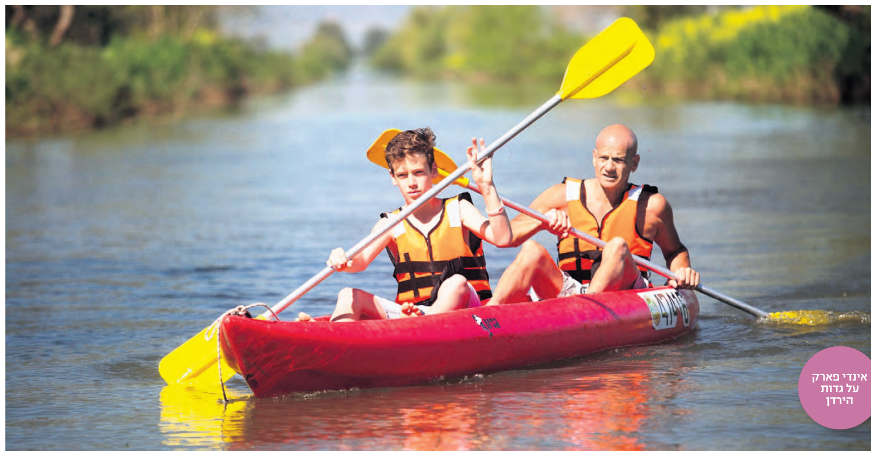
אינדי פארק על גדות הירדן