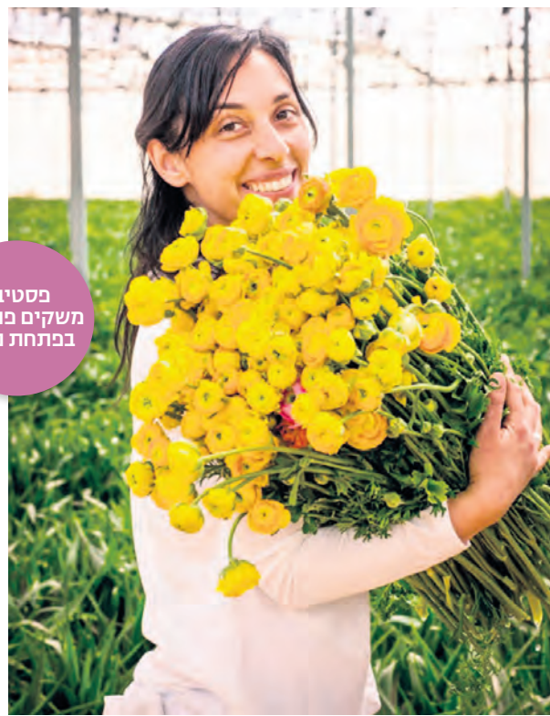
פסטיבל משקים פתוחים בכתחת ניצנה

פתאום טיילתי בשדות וניסיתי להיזכר בשמות הצמחים, שפעם ידעתי לשלוף את שמם ברגע. אפילו גיליתי מקומות במחוזות ילדותי בעמק הפר ולא הייתי מודע לכמה האזור השתנה. במסגרת השיטוטים שלי והמפגש המחודש עם המשועלים והנופים של הארץ, הרחיקתי קתי עד הערבה התיכונה והתאהבתי בה. ממש הופתעתי למצוא את עצמי נופל שבי בקסמי נופיה המרבריים המהפניטים, במכמניה ובסדרותיה, באיכות הירקות והנהדרים שגדלים בחממות שלה, ביצירות של האמנים והאמניות, במטעי מים של השפים, בתוצרת של המגדלים והחקלאיות. אהבתי את השקט והדרמות