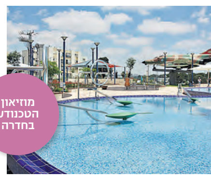
מחיאון הטכנודע בחדרה

מדעטק, המוזיאון הלאומי למדע, טכנו'ר לוגיה וחלל בחיפה, משיק בפסח את "מעשה פלאים", תערוכה מקורית של המוזיאון הכר