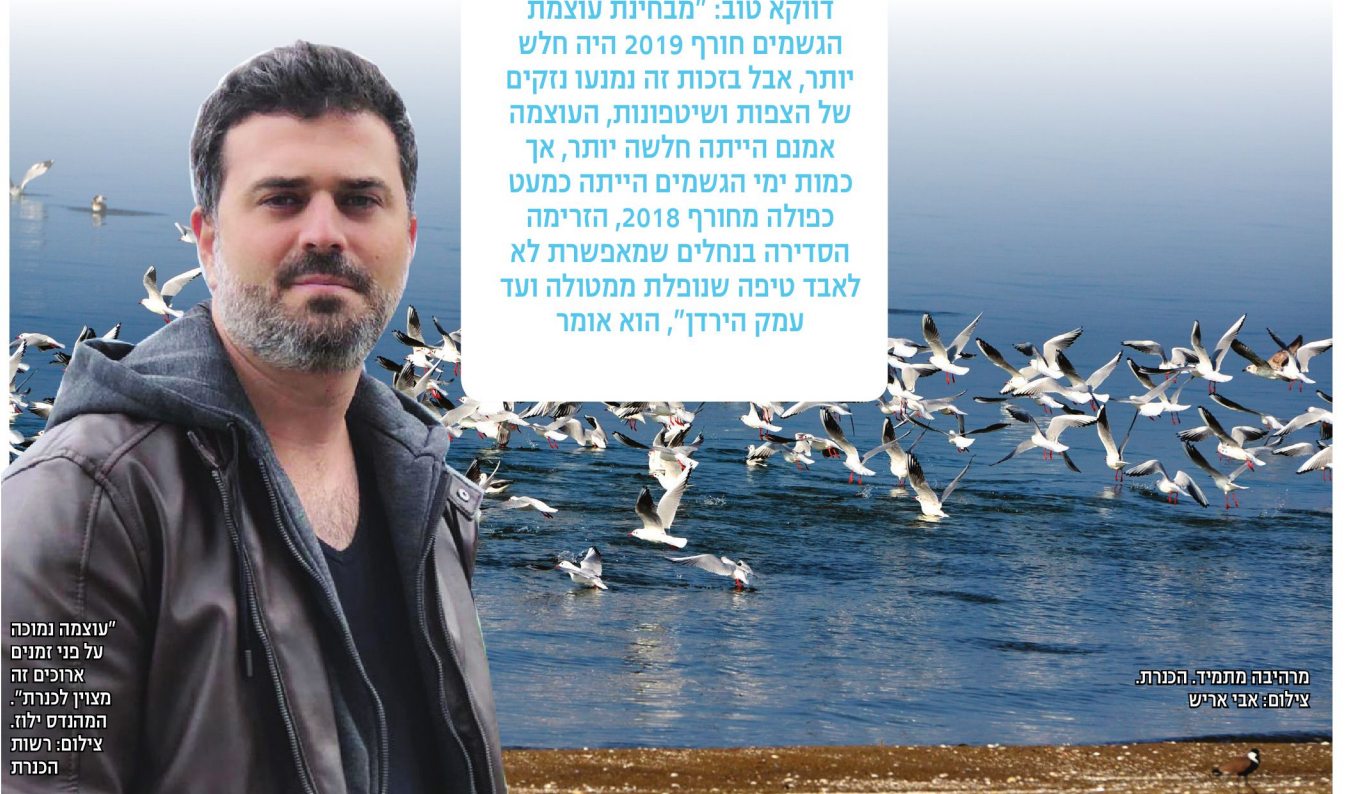
"עוצמה נמוכה על פני זמנים ארוכים זה מצוין לכנרת". המהנדס ילחז.

לכמויות של אז, נוכל לדבר על מספיק. "אומר אחד הנשאלים. "העיקר שיש מבקרים, העסקים נשענים בהצלחתם על הכנרת, כשיש עלייה במפלס, מגיע להם להרוויח" משיב אחד אחר. גם נושא ההתפלה עולה בקרב הנשאלים ואחת מהן משיבה לי: "כל כך הרבה שנים מדברים על הנושא הזה, אז היום אולי אין צורך כי אנחנו אחרי חורף מצויין, אבל כשהחורף לא טוב, שיבצעו את זה ואז נוכל באמת לשמוח, מוקדם ומאוחר לשאלתך". "יש מספיק מים, תמיד." מגיב אחד הנשאלים, "לא ייגמרו המים, הם רק משנים מצב צבירה, מנוזל לגז שחוזר להיות נוזל", כשאני מתקיל אותו ושואל: "ואם יהיו פה עשרה חורפים כמו החורף הקודם בלי לחזור להיות נוזל, או לפחות בכמויות קטנות בהרבה מהשנה, מה אז?" עונה בחצי גיחוך "מנהיג" הפרלמנט שישב שם: "אז, שימצאו פתרון, יש ממשלה שמקבלת החלטות ואנשים שמקבלים על כך כסף".