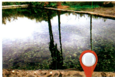
בריכת שכלשון. נחל נון

שמגיעים לבית יגאל אלון (אם יש זמן מומלץ להיכנס ולהתרשם מהתצוגות במוזיאון, ממשכים). ממשכים לנחל צלמון, שאותו עוברים על גשר מתכת, ומתקדמים עד שמגיעים לנקודה שבה "שביל סובב כנרת" פוגש בחוף האילנות את השביל השחור של נחל נון. פונים מערבה, חוצים (בוזהרות!) את כביש 90 וממשיכים לאורכו של הנחל עד עין נון. עין נון (ממוקם באזור המושבה מגדל) הוא חלקת גן עדן תחת עצי דקל, עם מים צלולים ומתוקים. הוא מחולק לשתי בריכות: אחת נגישה לציבור, ואחרת נחבאת בסבך. המעיין משמר את שמו הקדום של המקום - מגדל נוניא. "נון" בארמית פירושו דג ובבריכות אכן יש דגים רבים. רשות הכנרת הכשירה את